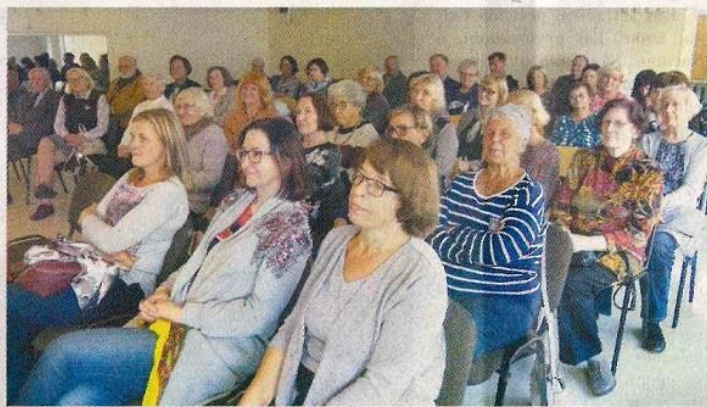
Klausytojų prisirinko pilnutėlė salė.