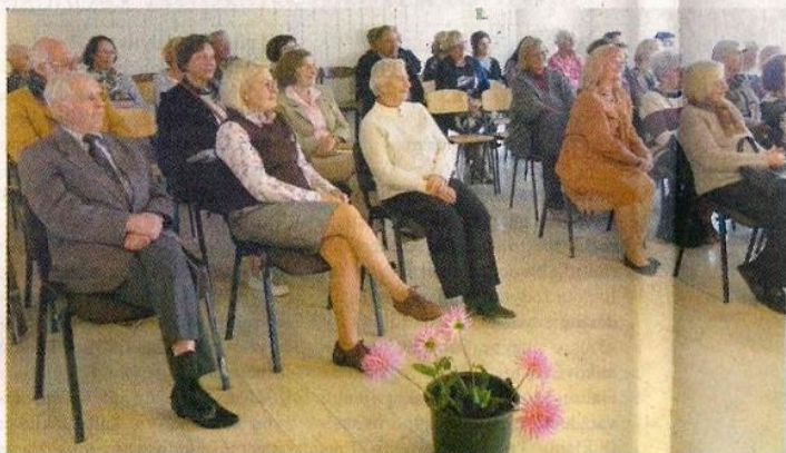
Kibiras su jurginiais laukė lietaus, bet nesulaukė.