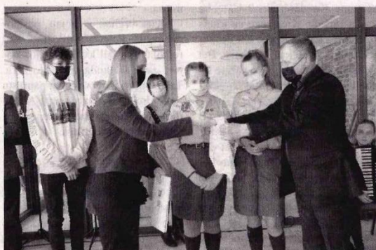
Svečiams – simboliškos atminimo dovanos.