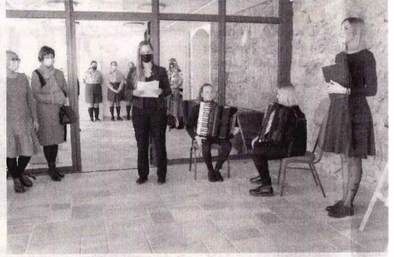
JAV ambasados atstovai į Kupiškį atvežė po Lietuvą keliaujančią amerikiečių fotografijos pionieriaus, etnologo E. S. Curtiso parodą „Šešėlių gaudytojas“.

Viešnioms iš JAV ambasados įteiktos dovanos – simbolinės se-