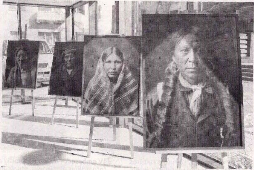
Parodoje – tik mažytė dalis fotografijų iš didžiulio E. S. Curtiso palikimo.

Jose įamžintas 30 metų trukusios fotomenininko pastangos, siekiant išsaugoti, nufotografuoti Šiaurės Amerikos indėnų kultūros