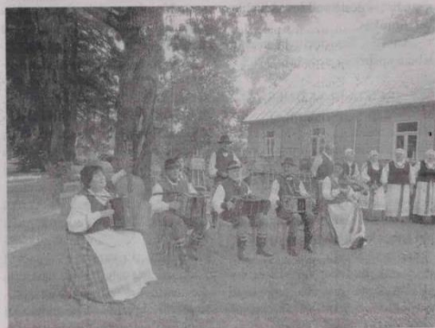
Upragė – „Gailėtinai, ir šimtas metų praėjo“