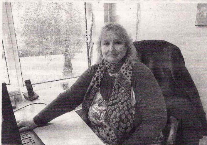
Lankytojų aptarnavimo skyriaus laikinoji vedėja, papasakojo, ką šiuo metu mėgsta skaityti kupiškėnai.