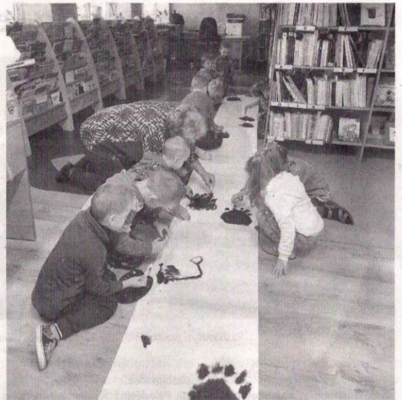
Mažyliai piešė lokio pėdų atspaudus.