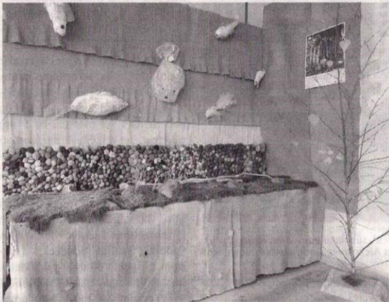
Mokinių sukurta meninė kompozicija.

Perskaitę knygutę, vaikai puikiausiai žinojo, ką reikia daryti ir ko negalima daryti sutikus lokį. Vaikai nupiešė lokio pėdsakus, dainavo daineles apie gyvūnus, kalbėjosi, kad laukinių gyvūnų nereikia bijoti, nereikia erzinti, bet reikia būti draugiškiems ir tada šie gyvūnai elgsis draugiškai. Mažyliai ir