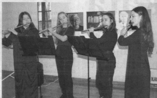
Per renginį koncertavo Kupiškio meno mokyklos auklėtiniai.

ką policijos pareigūnams, kad jie visada yra pasiekiami, džiaugėsi glaudžiu bendradarbiavimu su kaimo bendruomenėmis.