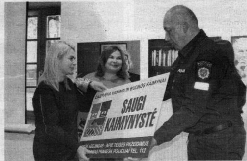
Kupiškio mokyklai „Varpelis“ įteikta saugios kaimynystės lenta. Ši ugdymo įstaiga tapo 33-ia saugios kaimynystės grupe rajone.