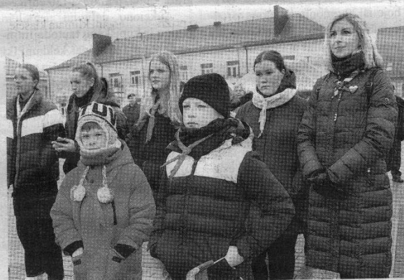
Valstybės atkūrimo dieną minėjo ir jaunieji Kupiškio skautai