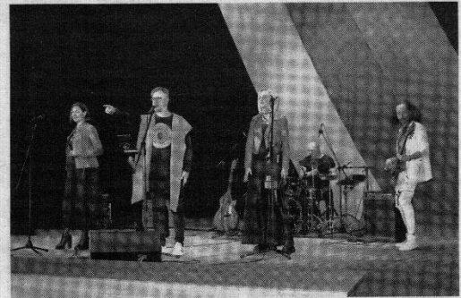
Koncertavo grupė iš Ukrainos „TaRuta“.

kopija parduotas už 120 eurų. Mažiau populiarūs aukcione buvo marškinėliai su įvairių sporto šakų atstovų autografais. Iš viso per aukcioną surinkta 3 640 eurų.