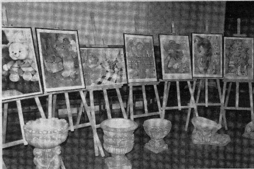
Labdaros aukcione Ukrainai remti jo dalyviai galėjo įsigyti Kupiškio meno mokyklos mokinių, tautodailininkų darbų, įvairių daiktų su sportininkų autografais.

Paramos koncerto metu žiūrovai paaukojo 595,60 Eur ir 5 svarus.