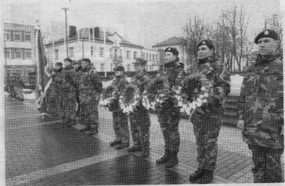
Vasario 16-osios minėjimo akimirks Lauryno Stuokos-Gucevičiaus aikštėje.