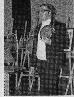
Brangiausiai aukcione parduotas šis diskas.