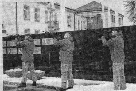
Nuaidėjo trys solvės – už Lietuvą, jos žmones ir Ukrainą.

Vasario 16-ajai, Valstybės atkūrimo dienai, skirti šventiniai renginiai Kupiškėje prasidėjo šv. Mišiomis Kristaus Žengimo į dangų bažnyčioje. Vėliau jie tęsėsi centrinėje miesto aikštėje, kur pakelta Lietuvos valstybės vėliava. Etnografijos muziejuje surengta istorinė paskaita, o po pietų visi norintys rinkosi į Kupiškio kultūros centrą. Čia surengtas labdaros aukcionas Ukrainai remti, skambėjo ukrainiečių grupės „TaRuta“ dainos. Vienas svarbiausių visų renginių leitmotyvų būtent ir buvo Ukrainos tema.