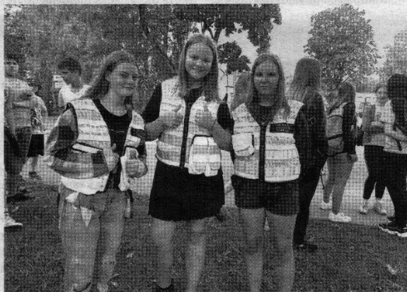
Kadangi renginys vyko Alizavos miestelio centre, viešąją tvarką prižiūrėjo jaunosios policijos rėmėjos.