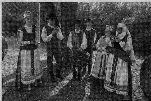
Kupiškio kultūros centro vaikų ir jaunimo folkloro ansamblis „Jaunimo Ramuva“ mokė šokti ratelinius liaudies šokius ir atliko kelis autentiškus Alizavos krašto kūrinius.