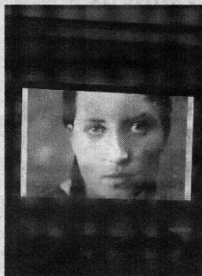
Filmo stop kadras.