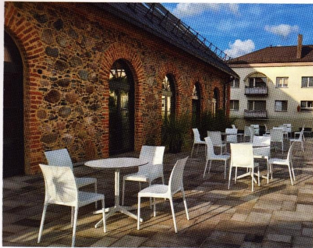
Lauko terasa – skaitytojų pamėgta susibūrimo vieta.