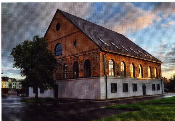
Atnaujintas, bet autentiškumą išlaikęs Kupiškio rajono savivaldybės viešosios bibliotekos pastatas.

Simboliška, kad kartu su pirmaisiais atgimstančios gamtos ženklais po daugiau nei šešerių metų rekonstrukcijos darbų duris atvėrė Kupiškio rajono savivaldybės viešoji biblioteka, įsikūrusi įspūdingame senoviniame masyvaus akmens mūro pastate. Atnaujintos ir visapusiškai pasikeitusios bibliotekos oficiali atidarymo šventė surengta kovo 24-ąją, tądien garbūs svečiai sveikino bibliotekos bendruomenę ir linkėjo prasmingai išnaudoti šiuolaikiškas ir modernias erdves.