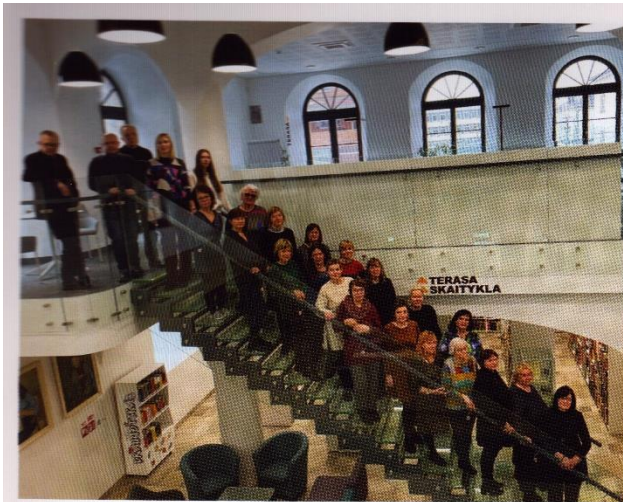
Kupiškio viešosios bibliotekos darbuotojai ant pirmą ir antrą aukštus jungiančių stiklinių laiptų.