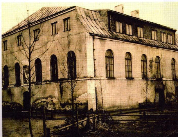
Senasis bibliotekos pastatas iki rekonstrukcijos.

Kupiškio miesto centre stovinčio pastato su arkiniiais langais neįmanoma nepastebėti. Jis mena gausią Lietuvos žydų bendruomenę, ilgą laiką čia buvo maldos namai – Didžioji sinagoga. Po tragiškų 1941 m. įvykių, brutaliai sunaikinus žydų bendruomenę, pastatas liko be šeimininkų. Per Antrąjį pasaulinį karą buvo apgriautas, liko tik sienos ir rytų fasado frontonas, jo vidurinėje dalyje buvo apskritas langas, o kampuose – rombo formos langeliai.