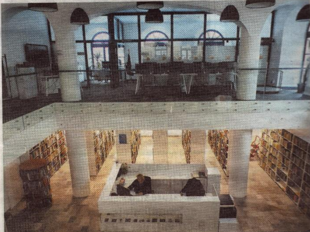
Žvilgsnis žemyn – į knygų saugyklą.