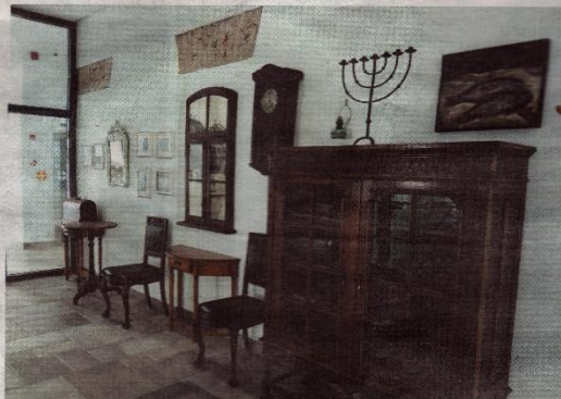
Žydų bendruomenės istorijos ženklai.