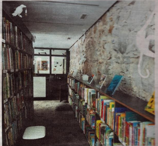
Vaikų erdvėje paliktas senos sienos fragmentas.