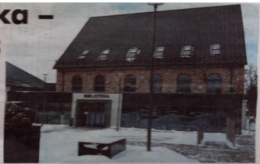
Savivaldybės viešoji biblioteka.

Antrajame aukšte, koridoriuje, žvilgsnis patraukia XX a. pradžios žydiškosios miestelio bendruomenės buities fragmentai – senos nuotraukos ir baldai, menora, įskilusi žibalinė lempa, senas gramofonas, autentiško sinagogos langų kopija – jį atvėrus galima išvysti anuometinio Kupiškio miesto centrinės gatvės vaizdą iš senos Etnografijos muziejaus išsaugotos nuotraukos. Kitur koridoriuje vėl netikėtumas – keistas, vaizdą iškreipiantis veidrodis, sena komoda, lyg