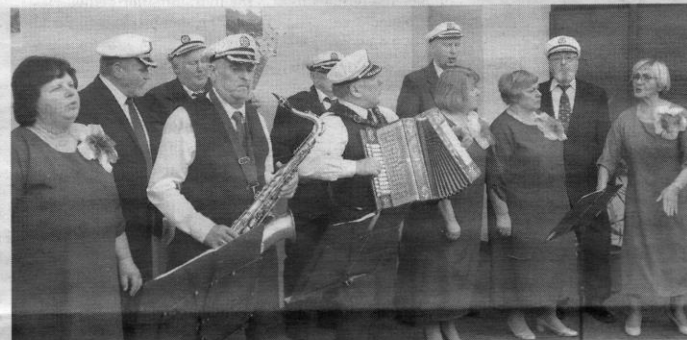
Koncertavo kapela „Gegužinė“.