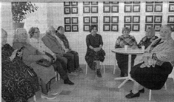
Į „Naktį bibliotekoje“ susirinko nemažai kvietinių svečių.