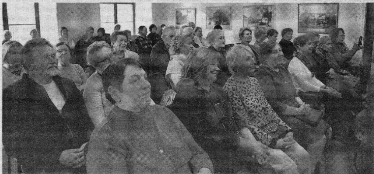
Knygos pristatymo dalyviai.