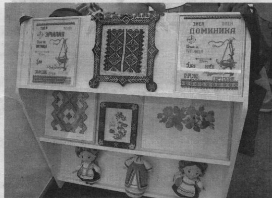
Buvo apžiūrėta ukrainiečių siuvinėtų darbų paroda.