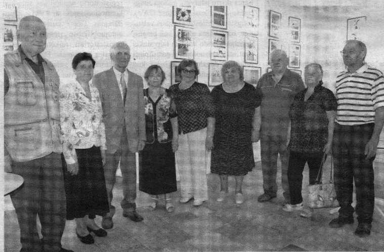
Su parodos atidarymo renginio svečiais.