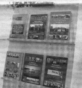
Šiame stende trūksta tik vienos T. Užos knygos „Viešintų mokykla - lyg vakar palikta“.