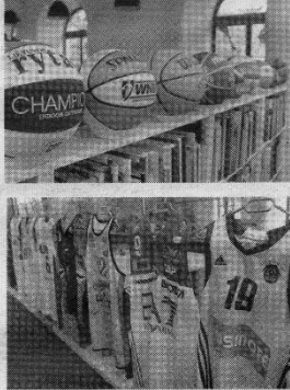
Parodoje pristatyta įvairi sporto atributika.