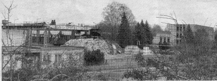
Pramoninis Kupiškio peizažas.

Ekskursija „Pramoninis Kupiškis“ , kurią lapkričio 22 dieną surengė Kupiškio r. turizmo ir verslo informacijos centras ir Kupiškio viešoji biblioteka, sutraukė nemažai žmonių. Vieni čia atėjo iš smalsumo ir noro pažinti Kupiškį, kitus paakino dalyvauti ekskursijoje sentimentai, nes kažkada jų darbinė veikla buvo susijusi su įmonėmis, kurios jau tapo istorija.