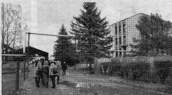
Trijų aukštų buvusios Kupiškio statybinių medžiagų gamyklos administracinis pastatas tebestovi.