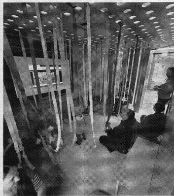
Akimirkos iš „Žirniukų“ klubo užsiėmimų.