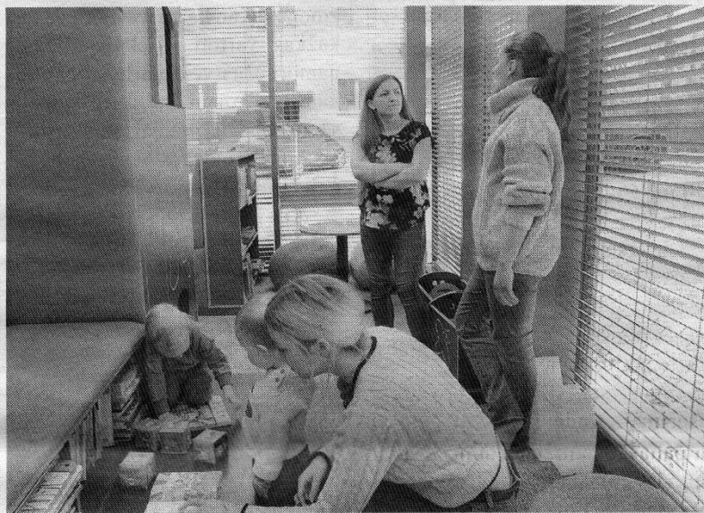
„Žirniukų“ klubo užsiėmimas.