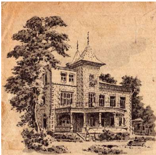
Кировакан. Санаторий „Армения“. Հրովական «Արմենիա» սանատորիան