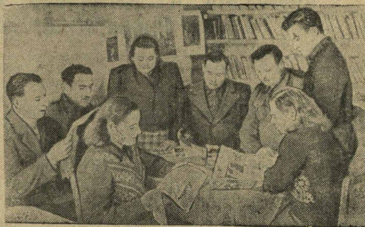
Didelį agitacinį darbą atlieka Troškūnų rajono Kazimiero Štaro vardo kolūkio klubas-skaitykla. Čia agitatoriai dažnai praveda pasikalbėjimus su rinkėjais. Klube-skaitykloje yra daug rinkiminės literatūros bei vaizdinės agitacijos priemonių. N u o t r a u k o j e: Troškūnų rajono Kazimiero Štaro vardo kolūkio klube-skaitykloje.