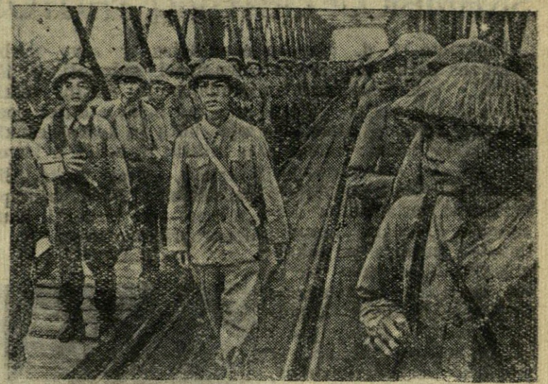
Vietnamo Demokratinė Respublika. Neseniai įvyko Chanojaus miesto perdavimas Vietnamo Demokratinėi Respublikai. Nuotraukoje: Liaudies būriai įžengia į Chanoją.