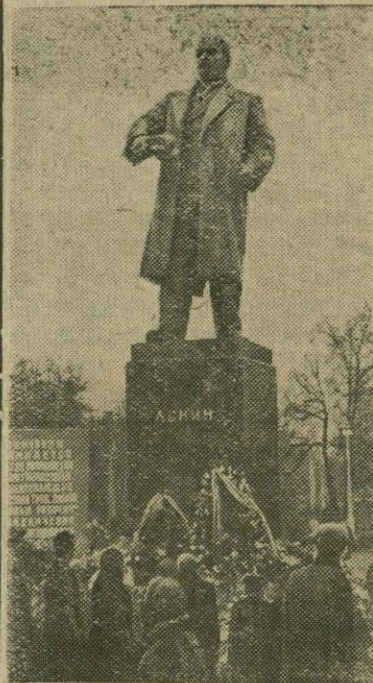
Molotove atidengtas paminklas Tarybų Sąjungos Komunistų partijos įkūrėjui, pirmosios pasaulio tarybų socialistinės valstybės organizatoriui, viso pasaulio darbo žmonių vadui ir mokytojui V. I. Leninui. Nuotraukoje: paminklas V. I. Leninui Molotove.

Kupiškio statybos-remonto kontoros mūrinių brigados mūrinkas