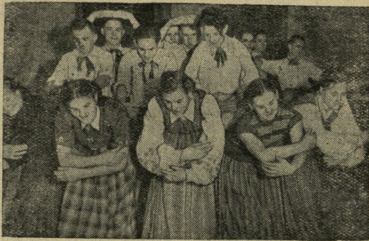
Skaidvilės rajono meninės saviveiklos rateliai išvystė aktyvią veiklą. Čia organizuota 36 choro rateliai, 17 liaudies šokių ratelių, dramos ir kiti rateliai. Nuotraukoje: liaudies šokių ratelio repeticija Skaidvilės rajono Stalino vardo kolūkyje.