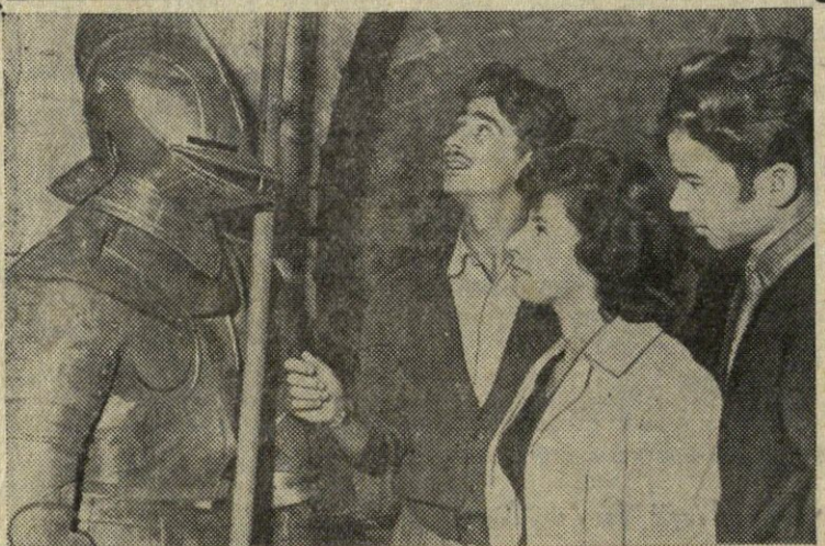
Nuotraukoje: lankytojai Gedimino pilyje — muziejuje.