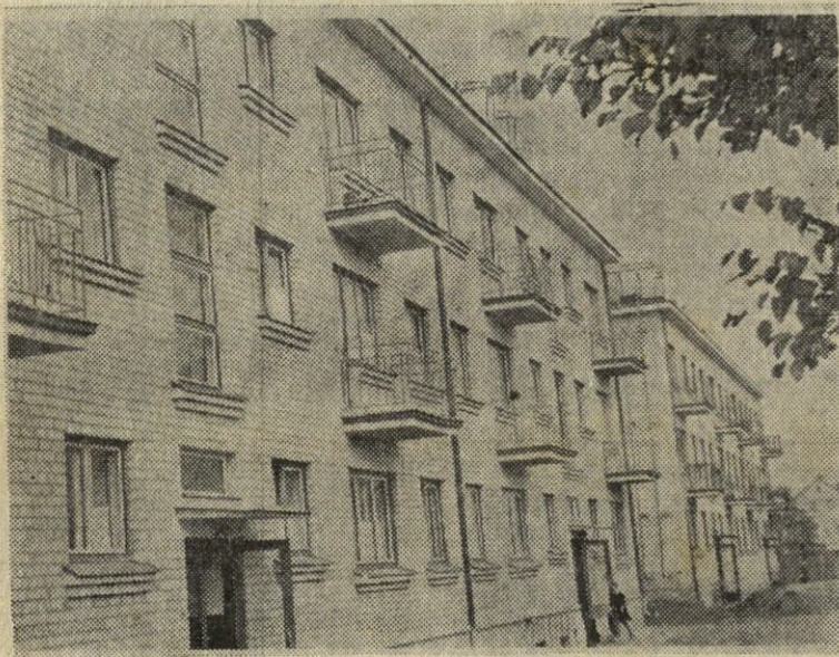
Neatpažįstamai pasikeitė Tauragės Tarybų valdžios metais. Didžiuliai gyvenamieji namai miesto centre, plačiaekraninis kinoteatras, moderniška valgykla — visa tai išaugo per pastaruosius trejus metus.

Nuotraukoje: šių namų Tarybų gatvėje gyventojai pirmą kartą šventė Spalio šventės naujuose butuose.