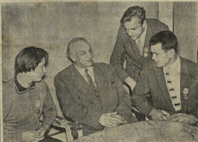
Neseniai Lietuvos TSR Aukščiausiosios Tarybos Prezidiumo Pirmininkas J. Paleckis įteikė vyriausybinius apdovanojimus respublikos sportininkams — XVII Olimpinių žaidynių Romoje dalyviams.

Gyvulininkystės fermų darbuotojai privalo dar kartą peržiūrėti visas esamas galimybes gyvulių žiemojimui pagerinti, dėti visas pastangas, kad, sutinkant TSKP CK gruodžio Plenumą, būtų įvykdyti įsipareigojimai gyvulininkystės produktų gamyboje. Žemdirbių pareiga — šiai įžymiajai datai pilnai užbaigti visus ūkinis rudens darbus, paruošti sėklą, žemės ūkio inventorių pavasario darbams.