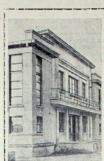
Nuotraukoje: naujas plotiekraniš kinoteatras Mažeikiuose.

Bet, deja, dar pasitaiko ir tokio jaunimo, kuris nemoka nei dirbti, nei ilsėtis.