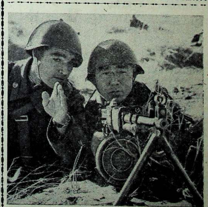
Taktiniai užsiėmimai N dalinyje.