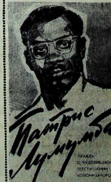
MASKVA. TSRS žurnalistų sąjunga išleido masiniu tiražu knygą, pasakojančią apie Kongo liaudies didvyrį Patrį Lumumbą. Šioje knygoje surinkti dokumentai, demaskuojantieji kolonizatorių sąmokslą prieš Kongo liaudį. Nuotraukoje: knygos «Patris Lumumbas viršelis».