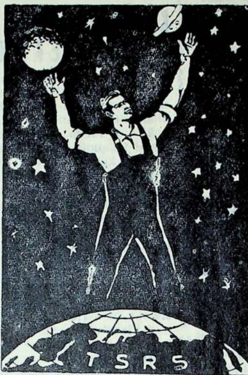
TARYBINIS ŽMOGUS — KOSMOSO NUGALĖTOJAS!

Kai išgirdau, kad mūsų savo ausimis. Ne, netikėjau, šalyje paleistas į kosmosą kad taip greit į kosmosą galimas-palydovas su žmogumi, tiesiog nenorėjau tikėti daugiau džiaugsmo suteiktė