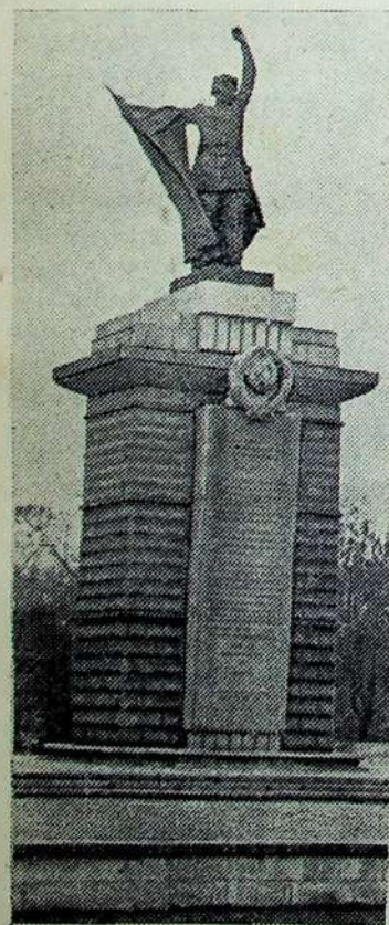
NUOTRAUKOJE: PAMINKLAS TARYBINIAMS KARIAMS — IŠVADUOTOJAMS BRNO MIESTE.