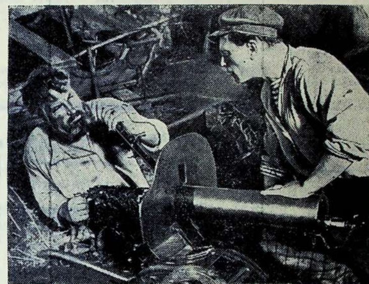
Nuotraukoje: kadras iš filmo «Pakelta velėna» (III ser.).