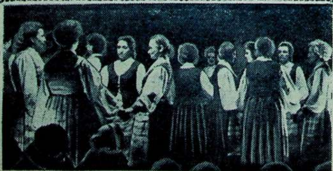
PASKUTINĖ REPETICIJA, RUOŠIANTIS KUPIŠKĖNŲ LIAUDIES ŠVENTEI.