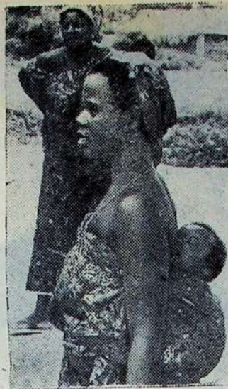
GANOS RESPUBLIKA. Taip daugelis Afrikos šalių moterų nešioja savo vaikus.