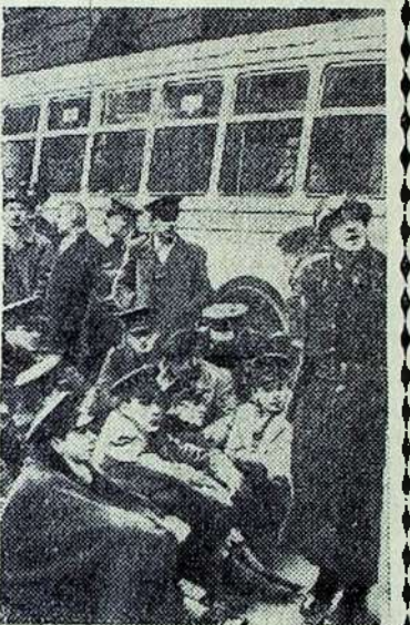
Belgija apimta visuotinio streiko. Fabrikai nedirba. Nereikia miesto transporto. Briuselyje, Lieže, Ant- verpene ir kituose miestuose vyksta masinės demonstracijos.

Nėra abejonės, kad kolek- tyvas, kolūkiečiai išauklės šį jauną žmogų. Ir jie tvirtai