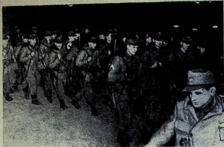
Prancūzijos keliais juda Bonos tankai su Vakarų Vokietijos kareiviais. Į Prancūziją atvyko 35 tūkst. tankai bundos- vero kareivių. Prancūzijos miestų Murmelono ir Sisono gatvėmis vaikština bundos-vero karininkai. Pagal Prancū- zijos vyriausybės sutikimą jie atvyko čia kariniam apmo- kymams. Prancūzų liaudis pasipiktinusi, kad vėl tyčiojama iš atminimo tų, kurie žuvo už tėvynės išvadavimą nuo grobikų.

Nuotraukoje: bundos-vero kareiviai žygio aprangoje vyksta į Murmeloną.