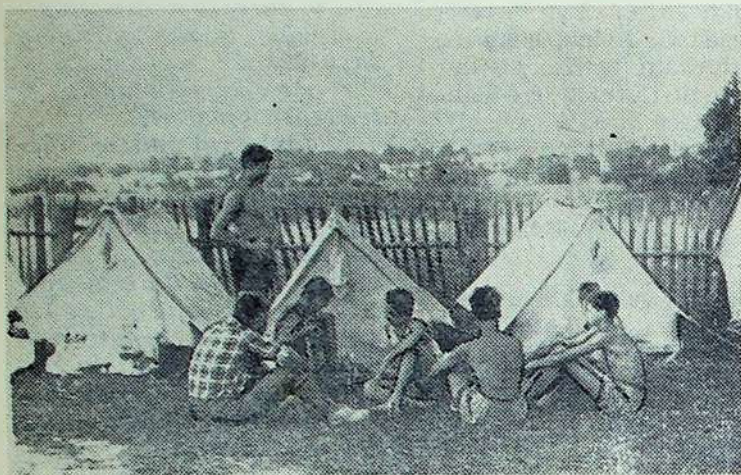
Poilsiaujame didingųjų Karpatų kalnų papėdėje.

budina kalnus: „Kalnai, kaip ir jūra, savo stichija pavergia žmonių širdis ir jausmus. Senovėje jie įkvėpdavo baimės ir prietarlingumo. Vėliau nepažabotos gamtos jėgos sužadindavo kovos įkarštį ir norą jas užkariauti; dabar jie taurina žmogų ir verčia susimąstyti, nes gyvenime, kaip ir kalnuose, yra daug aukštumų, kurias pasiekia tik pa-