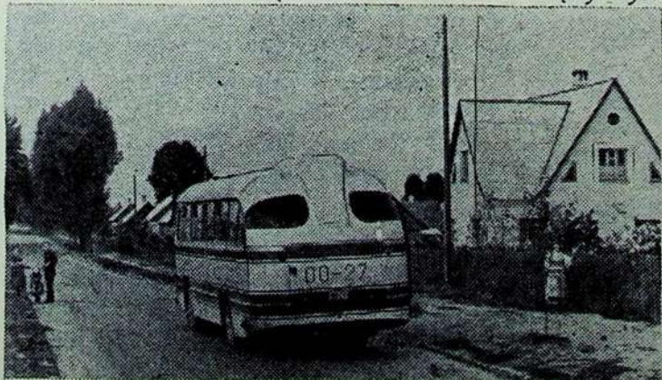
Nuotraukoje: Kauno rajono J. Biliūno vardo kolūkių gyvenvietės gatvė.

džiai apie kaimo ateitį. Didėja išleidžiama pro-