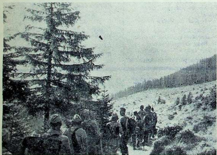
Kiekvienas žingsnis artina prie kelionės tikslo — Karpatų viršukalnės Goverlo. O ji jau netoli...

tys išstvermingiausiai. Jasinio miestelyje Ukrainos ir Lietuvos moksleiviai sužadė draugiškas krepšinio rungtynes. Jas laimėjo Lietuvos atstovai. Ypač gili įsikos kelionės, vieną vakarą, horizonte pasirodė didingi Karpatų kalnai. Jiems mes parodėme trumpą programą, kuria jie buvo labai patenkinti. Taip pat šio va-