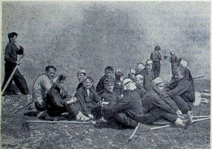
Mūsų turistinio žygio dalyviai Goverlo viršukalnėje.

viško! — ėmė jie prašyti. — Padainuokite! [vykdėme jų prašymą: ir pašokome, ir padainavome. Taip jiems patiko mūsų liau- dies šokiai, jog jie po va- landėlės ėmė prašyti, kad mes išmokytume juos lietu- vių liaudies šokių. Krykštaudami ir juokauda- mi guculus išmokėme šokti