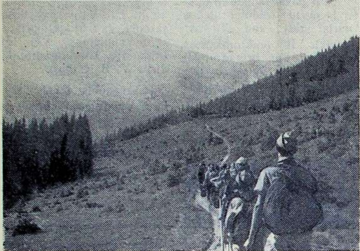
Iki kelionės tikslo — Karpatų kalnų viršukalnės Goverlo — beliko kelios valandos kelio.

Pasigėrėję Karpatais ir pailsėję, ėmėme leistis žemyn. Koks keistas jausmas! Lei- diesi žemyn ir, rodos, pačios kojos tave neša. Vos išsilai- ka, nepradėjęs bėgti, skristi... Liepos mėnesio pabaigoje mes pasiekėme Bogdaną. Vakare, lypsnojant laužui, susitikome su guculais. — Pašokite ką nors lietu-