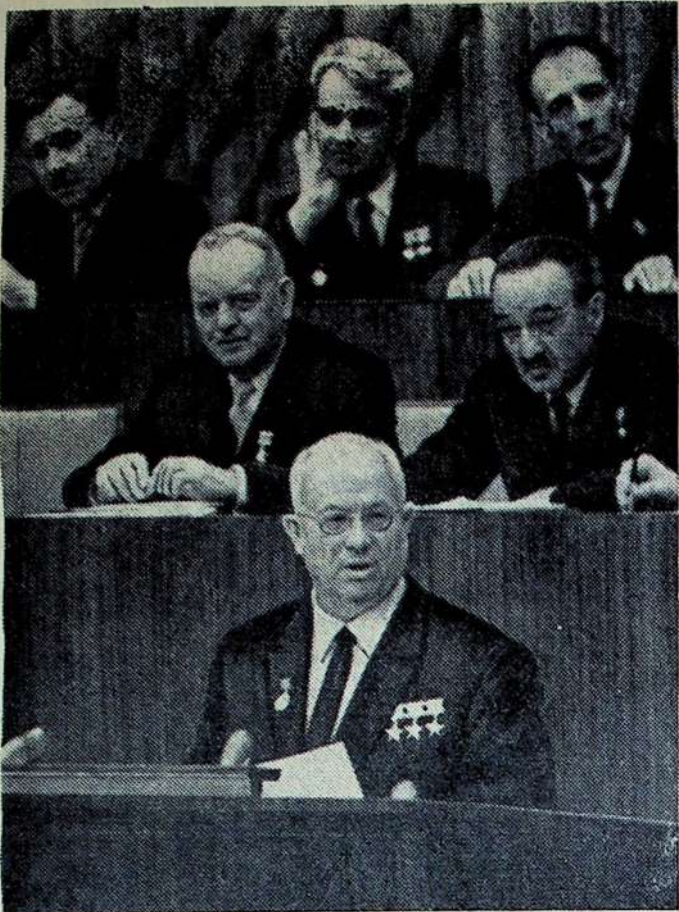
Maskva. Tarybų Sąjungos Komunistų partijos XXII suvažiavimas. Tribūnoje — draugas N. Chruščiovas.